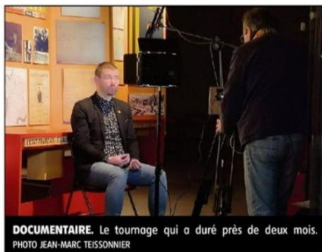
DOCUMENTAIRE. Le tournage qui a duré près de deux mois.

C'est d'ailleurs lors d'une des projections de ce film qu'il a eu l'idée de réaliser ce documentaire : « Des questions revenaient souvent sur la ligne de démarcation dont on ne sait pas grand-chose. Lors d'un festival de cinéma à Commeny, les organisateurs m'ont fait rencontrer Laurence Faucheu, une directrice de production. Je lui ai parlé du projet Ligne de démarcation en Allier et Saône-et-Loire en lui indiquant que j'avais déjà quelques interviews de personnes qui ont subi la guerre et passaient cette