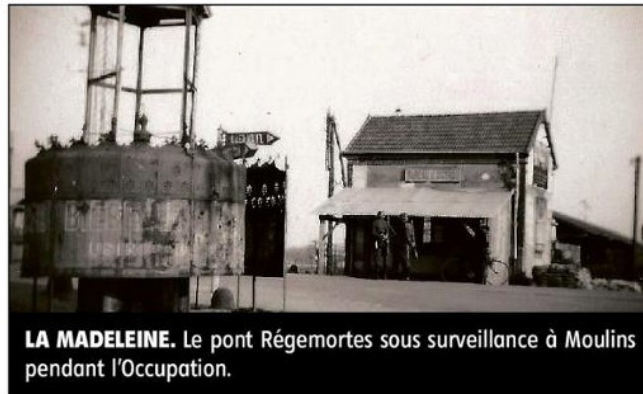
LA MADELEINE. Le pont Régemortes sous surveillance à Moulins pendant l'Occupation.