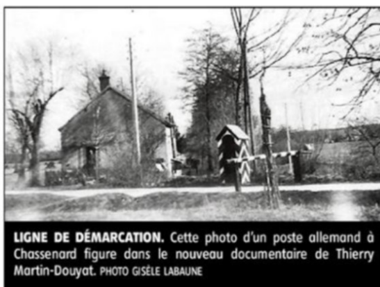
LIGNE DE DÉMARICATION. Cette photo d'un poste allemand à Chassenard figure dans le nouveau documentaire de Thierry Martin-Douyat.

Dans ce troisième film-documentaire consacré à la Seconde Guerre mondiale, dont le tournage a nécessité plusieurs mois, le réalisateur a voulu mettre en lumière les conséquences de la ligne de démarcation dans l'Allier comme dans le département voisin de Saône-et-Loire puisque, entre 1940